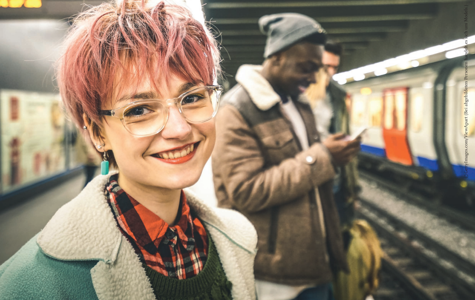
(Bei abgebildeten Personen handelt es sich um Models.)