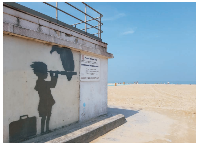
Abbildung 1: Banksy »Kind mit Koffer und Fernrohr« • Strand von Calais

und machen auf die Lebensumstände in Geflüchtetenlagern aufmerksam. Es handelt sich um eine translokale Bewegung, die im Dezember 2020 in der Stadt Innsbruck ins Leben gerufen wurde und mittlerweile in weiteren österreichischen Städten und anderen EU-Ländern in ähnlicher Form stattfindet. In Klagenfurt unterhalten die Engagierten Kontakte zu verschiedenen Geflüchtetenlagern,