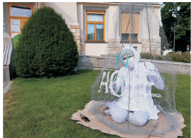
Abbildung 2: Wochenenden für Moria »(No)Hope« • Artivismus vor dem Stadttheater Klagenfurt von Barbara Ambrusch-Rapp

Die Performance greift das Leid geflüchteter Menschen auf und konfrontiert das Publikum mit dem gesellschaftlichen Wegblicken oder nur bedingten Hinschauen auf die Lebensumstände von Menschen auf der Flucht. Die weiße Kleidung symbolisiert »die Hoffnung, dass es vielleicht doch irgendwie positiv weitergeht« (Z. 139–140). Türkis steht für die Österreichische Volkspartei (ÖVP) und ihre primär abweisende Migrationspolitik. Die Performance veranschaulicht die Verzahnung von parteipolitischen Entscheidungen mit den Lebenssituationen