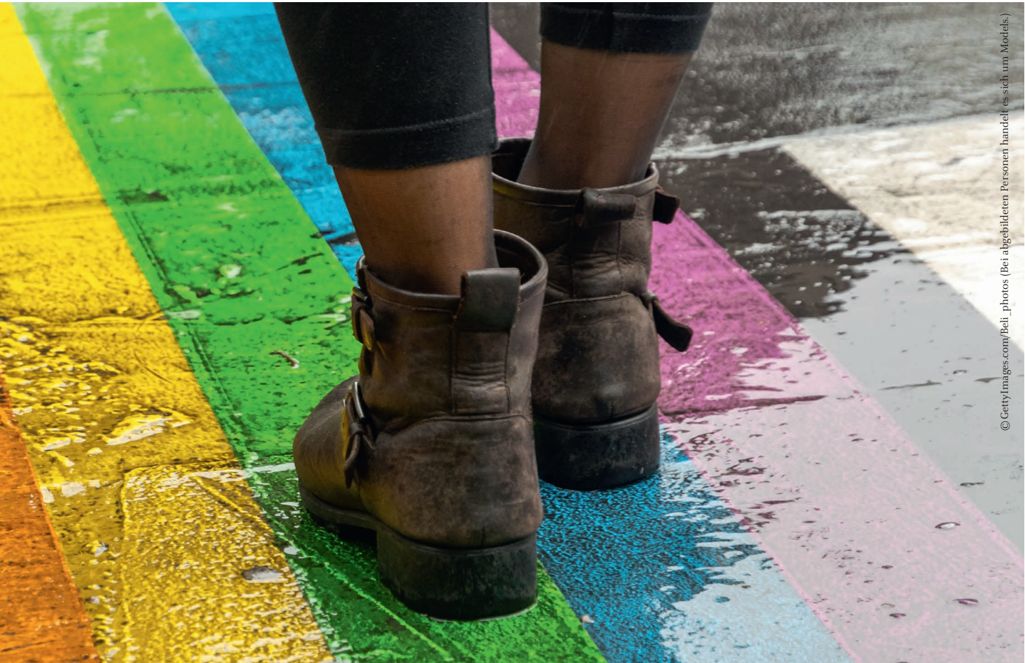
© Gettyimages.com/Bei_photos (Bei abgebildeten Personen handelt es sich um Models.)

beiten von Wagner (2009) und Maurer (2019) haben mit Blick auf die Historie Sozialer Arbeit ausführlich auf die Verwobenheiten sozialer Bewegungen und der Sozialen Arbeit hingewiesen, die mal Seite an Seite standen, mal in Distanz zueinander gingen. Mit Blick auf die gegenwärtige Situation werden soziale Bewegungen einerseits als Wegbereiterinnen zur Herstellung global gerechterer Verhältnisse und Impulsgeberinnen für die Soziale Ar-